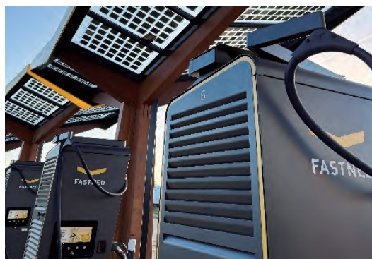
SA での高速充電設備