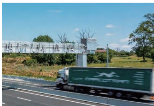
マルチレーンフリーフロー