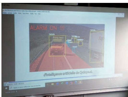
工事中安全への取組み