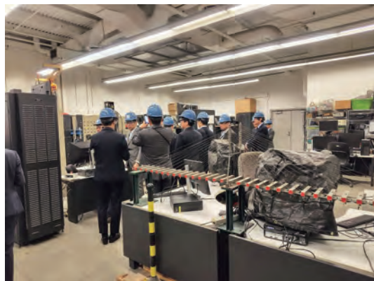
パデュー大学内の実験施設