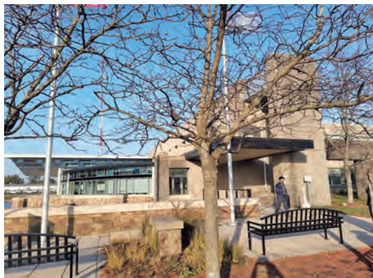
インディアナ州交通局外観

(公財)高速道路調査会では、令和6年10月27日～11月2日にかけて第66回海外道路調査団を派遣した。米国インディアナ州・テキサス州の高速道路における ITS 技術等に関する海外調査の概要を報告する8〔関連記事 p.51～〕。