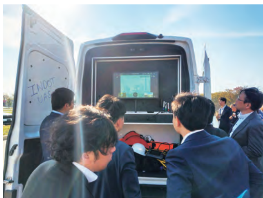
ドローン管理車両