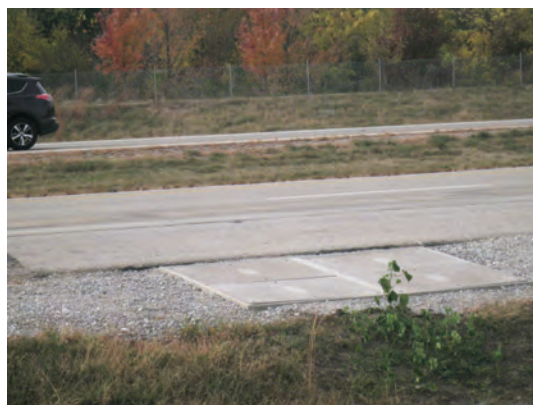
走行中給電試験路