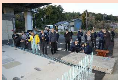
東名リニューアルしずおかプラザ

視察行程 静岡駅～静岡道路事務所分室～静岡IC(反転)～焼津IC～日本坂PA上り→日本坂PA～日本坂TN→日本坂TN 現場点検 視察→日本坂TN～静岡IC(反転)～焼津IC→焼津IC～袋井IC～現地→東名リニューアルしずおかプラザ