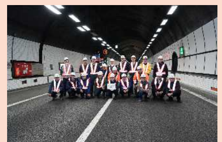
日本坂トンネル(上り)