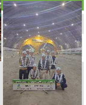
釜利谷庄戸トンネル